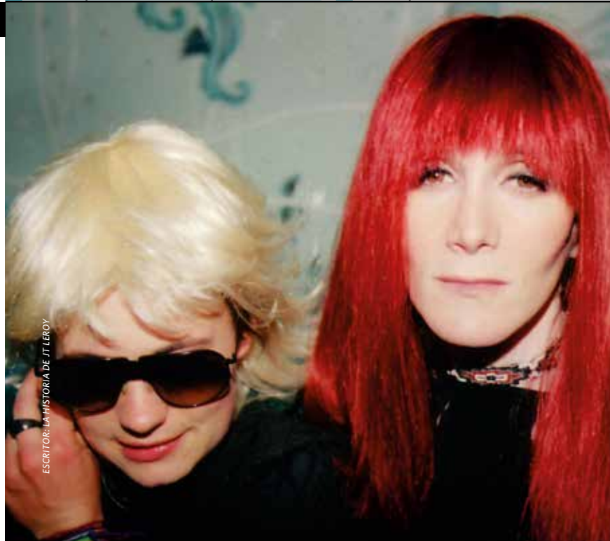
ESCRITOR: LA HISTORIA DE JT LEROY